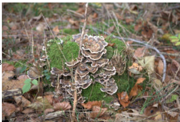
Pilze zersetzen das Holz; hier die Gattung Trametes am Stumpf eines längst gefällten Baumes.