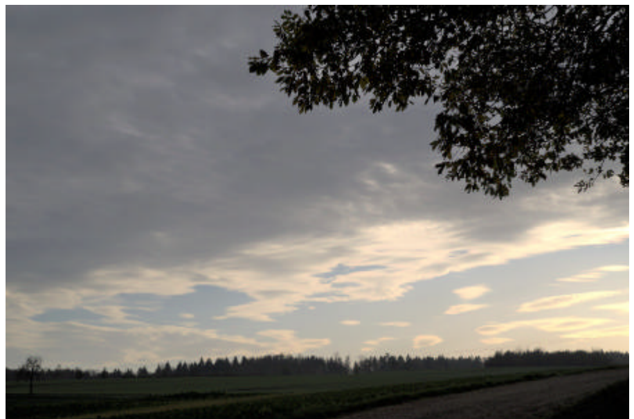
Nicht von jedem Standort aus sieht man auf dem Härtsfeld bei Föhn die Alpen. Weit hinter dem Horizont kann man die typischen Föhnwolken erkennen.

Die letzten Tage im November waren vom sprichwörtlichen Novembergrau gezeichnet: mit anhaltendem Nebel und Nieselregen verabschiedete sich der meteorologisch definierte Herbst.