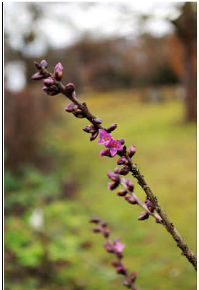
Der Seidelbast (Daphne) gehört zu den früh blühenden Sträuchern. Schon Ende Dezember öffnete er erste Blüten.

Abend blieben die Werte bis auf eine Ausnahme im Plusbereich. Sehr milde Atlantikluft mit dichten