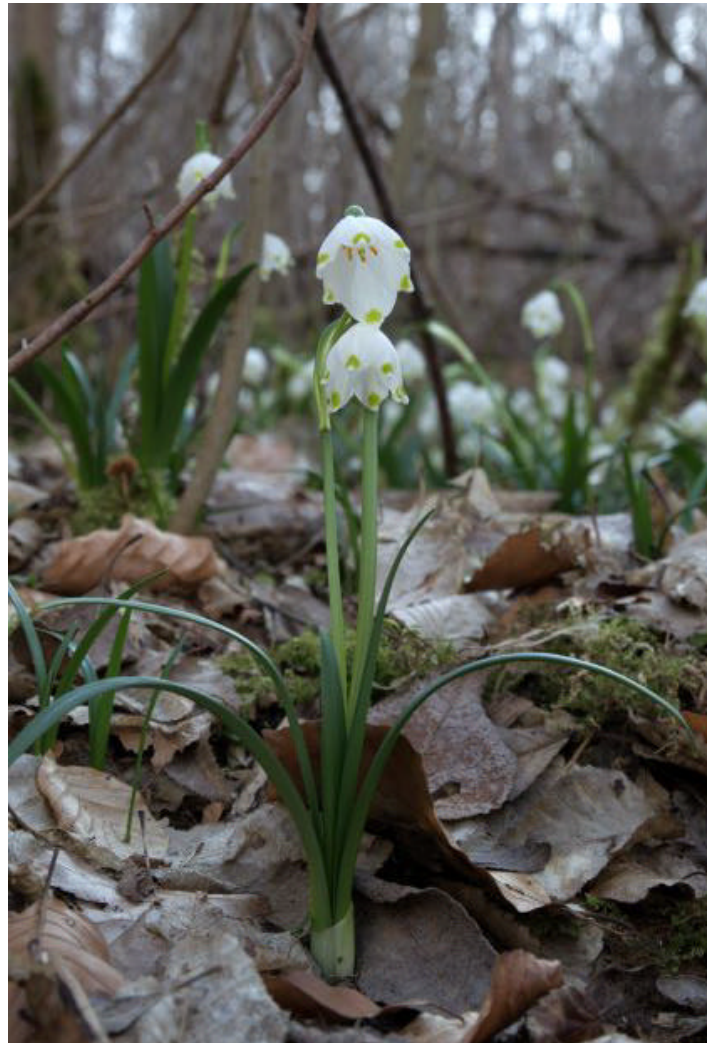
Die Frühlings-Knotenblume (Märzenbecher) hat einen dauerhaften Standort in den Hangwäldern des Egautals. Die langjährige Beobachtung bestätigt eine jährliche Zunahme der Anzahl an Individuen

Zu Beginn der zweiten Monathälfte konnte sich die Sonne etwas besser als zuvor durchsetzen. Bei geringer Niederschlagsneigung dominierte frühlinghaft milde Witterung bis in die dritte Dekade hinein. Tiefdruckgebiete über der Irischen See und der Nord-