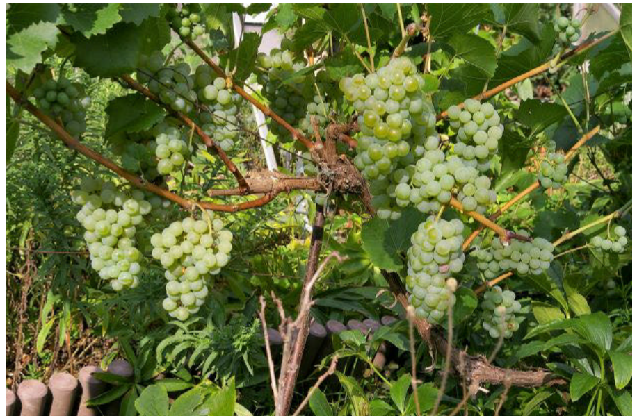
Für das Gedeihen der Weintrauben war die Sommerwitterung in diesem Jahr günstig. Sel- ten trug der Weinstock der Wetterwarte so gute Trauben.

nete das letzte Monatsdrittel den Witte- rungsverlauf. Bei überwiegend sommerlichen Werten um die 25-Grad- Marke für Sommertage und teilweise ge- wittiger Regenschauer blieb das Wetter auch nach dem kalendarischen Sommer- anfang der Jahreszeit entsprechend. Es fügten sich noch zwei heiße Tage mit genau 30 Grad Celsius zum statistischen Zahlenwerk hinzu. Einer davon war der Monatsletzte, an dem ein Gewitter mit Starkregen von fast 20 Liter pro Quadratmeter, die bis dahin geringe Mo- natsmenge aufbessern konnte.