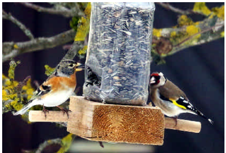
Bergfink und Distelfink sind Wintergäste an der Futterstelle.

Fasst man alle drei Wintermonate zusammen, zeigte sich der Winter trotz des eisigen Februars mit plus 0,3 Grad Celsius noch mild. Auch die Niederschlagsmenge wies in den drei Monaten mit 225,9 Liter pro Quadratmeter ein gehöriges Plus aus.