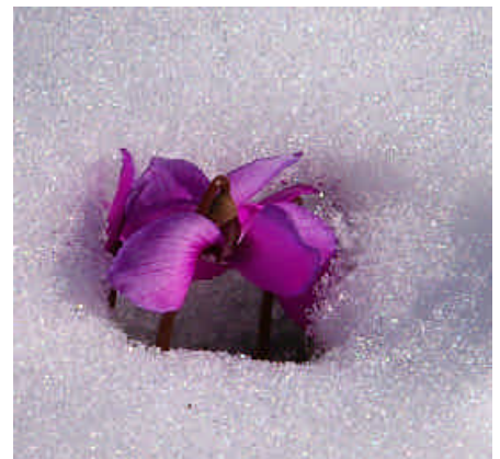
Das Alpenveilchen hält strengen Frost aus.

Jährlich würde die Einhaltung des Projekts vom TÜV überprüft. Auf die Frage, ob dann jedes Jahr Mitarbeiter des TÜV nach Papua-Neuguinea reisen, um zu prüfen und zu verifizieren, blieb die Antwort ungenau.