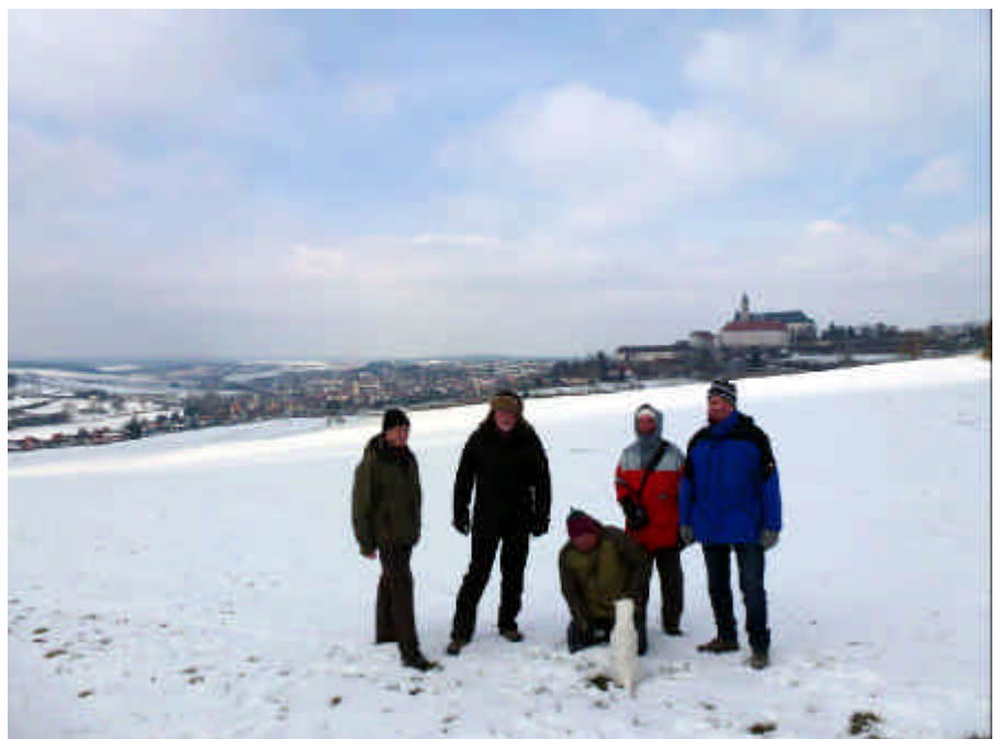
Das Härtsfeld ist auch am bisher kältesten Tag des Jahres für diese Wandergruppe eine beliebte Wanderregion.

Zum kalendarischen Winteranfang gelangte mit einer südwestlichen Strömung milde Atlantikluft auf die Ostalb: Weihnachtstauwetter, eine Witterungsbesonderheit, die man seit jeher kennt, die zwar nicht jedes Jahr, aber überwiegend beobachtet und dokumentiert wurde. Milde Temperaturen ließen die ohne-