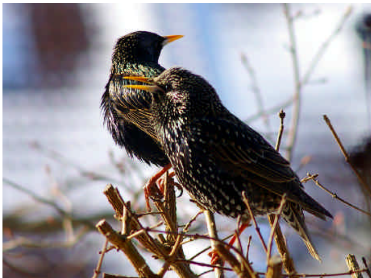
Stare trotzen Dauerfrost und Schneedecke zu Beginn des Frühlings.

hin dünne Schneedecke schwinden. Frostfrei und unbeständig blieb es bis zum 24.