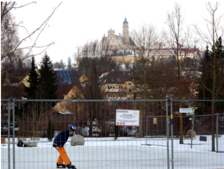
Gründlich hatte der städtische Bauhof die Voraussetzung für das Eislaufvergnügen in Wohnortnähe vorbereitet. Zwei Wochen lang konnte die Eislaufbahn im Egautal bei strengem Dauerfrost genutzt werden. Aber bei minus 15 Grad Celsius und sonnigem Wetter, als dieses Foto entstand, war es den meisten dann doch zu kalt. Der einsame Eisläufer konnte diesem Umstand Positives abgewinnen: „Hier hat man Platz und man muss keine Zusammenstöße fürchten.“

Schneedecke gebildet, die durch die milde Witterung aber bald wieder abschmolz. Noch einmal bildet sich auf dem etwas kühleren Härtsfeld und dem Albuch nach starkem Niederschlag im ersten Monatsdrittel für einen Tag lang eine