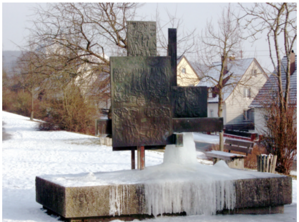
Tief gefrorene Stadtgeschichte im Februar: Der Brunnen des Neresheimer Künstlers Fritz Rothmaier erzählt die schrecklichen Ereignisse aus dem 30jährigen Krieg: Die Blutnacht von Neresheim im Jahr 1634. Die Mordlust der kaiserlichen Soldateska brachte zwei Drittel der Einwohner um. Einige Orte auf dem Härtsfeld wurden gänzlich ausgelöscht

In rascher Folge zogen die Sturmtiefs mit mächtigen Regenwolken von Westen nach Osten und trafen, wenn auch in abgeschwächter Form, die Ostalb. Am stärksten wirkte sich das Tief „Joachim“